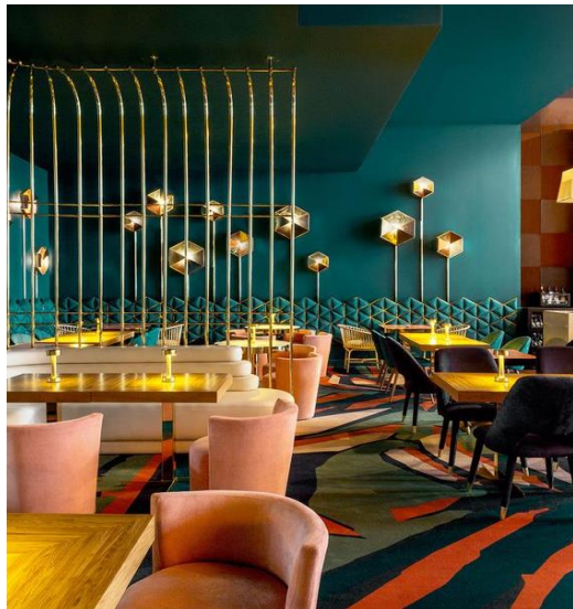
وینە (۴) کافینی لاریوس بە رەنگی کۆنتراست، لە شاری مەدرید دیزاین کراوە لە لایەن تۆماس ئالیا