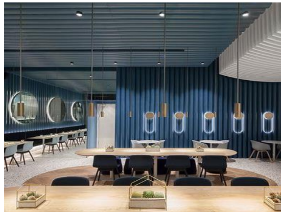
وینهی (۵) گلهاری گاگا کینگ دیزاین کراوه له لایهین COORDINATION ASIA له شاری شینژن / چین