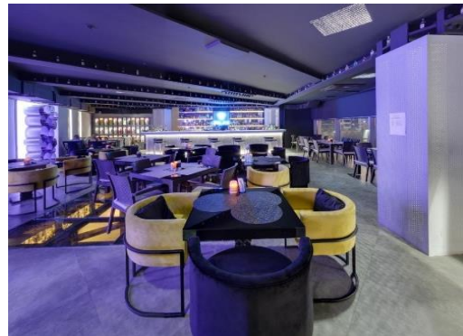
وتیبه کانی (۹-۱۰) کافترای The spot له گولان ستی، به رهنگی سپی و خۆله میشی، له گه ل کاردانه وهی روناکی دستکردی (LED) به رهنگی مۆر

بۆ نمونه ئەو شوینیە که زیاتر ژاوه ژاوه رهنگی بریسکه داری تیدا بۆیه کراوه، وه رهنگی گهرمه کان دهیبت ههستیارت مامه له یان له گه ل بکریت بهراورد به رهنگی سارده کان. (جاسم، ۲۰۰۷، لا ۲۷-۳۰) به مشیوه به ئیمه له رهنگی ناوه رۆک و گرنگی شوینه که یه وه ههست به جوانی رهنگ ده کهین، دابه شکردنی رهنگ پینوستی به هه لئاردنی باش و گونجانی ریزه ههیه، ههروه ها رهنگی کان به پشی پلهی روناکیه کهی که تیدایه ده بیترین، وه بۆ ئەوهی له گه لیدا بگونجیت دیزاین بکرین ئەگه ر رهنگ به شیوه یه کی کاربهر به کاربهرینریت، ئەوا چهن دین ئەنجامی جوانکاری و ده برین دهدات بۆ رونه کردنه وهی ناوه رۆکی راسته وخۆی کاربهریه دهرونییه کان. لێره دا ده زانریت رادهی ئەو کاربهریهی که به هاگانی رهنگ له سه ر... به کارهیننه له رهنگی فرهی پۆله کانیانه وه و به یی ئاره زو و مه یلی خۆیان، ئەمهش له رهنگی لیکۆلینه وه کانه وه سه لیزاوه که دیزاینه کانیان به رهنگی کان ئەوه لوه یه تیان داوه بۆ سه رکه وتن و کاربهری، وه زمانیکی جوانیه و له هه مان کاند زمانیکی... ده برینه، وه ک چۆن له و رهنگی به وه دیزاینه ری فه زا بازرگانیه کان سه روشتی بیروکه که و ته کنیکه کانی دیزاینه کهی ناویره ده کات. (نصیف، ۲۰۰۲، لا ۳۱)