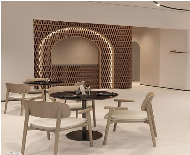
وینهی (۲) دیزاینی کافی له دوهی له لایه نهمجد سالوم دهزاین کراوه