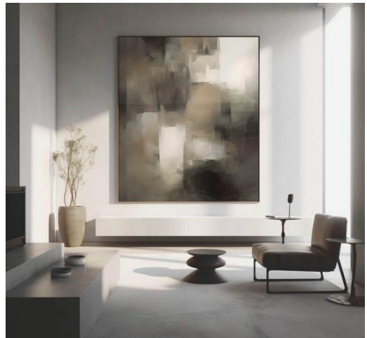
وینەکانی (۷-۸) هونەری مینیالیزم، رەنگی بیدەنگ، لەگەڵ کاردانەوێ رەنگی ھەمەچەشن لەگەڵ تۆنی قاوینی گەرمی نیلا یەن، هونەری مۆدێرن، هونەری دیوار بۆ ژووری میوان، نووستن، ئۆفیس، چیشخانە و کافێ.

بەلام بە وریایی. (Clifford, 2002, p. 166)