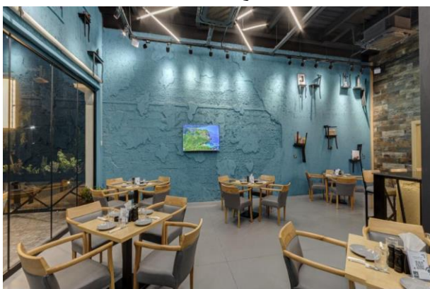
وینە (۸) وهسفی گشتی