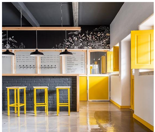
وینهی (۱) گهلهی بریویاب له کولاریس له لایه ن وینهگری ته لارساز مونتینیگرؤ دیزاین کراوه

لهناو نهم هیئل و فهزایانه دا ههیه دروست دهن، وه ئه و لوکس و جوری ئه و کهرهستانه به دهست دههینیت که بو تیشک خسته سه ری سینوگرافیهکی تهواو له ژینگهکی ناوهوی فهزایهک که روداوو کارایی و ژاییهکان به گشتی تیدا رودهدن. (توخمه بیترهوه کانی وهک هیئل، شیوه، بارسته و ئه و پیشنایانهی که رونایک بهرز دهکاتهوه نوینه رایهتی به هایهکی ناوهکی له خویاندا ناکن، به لکو به هایهکیان په یوهسته به په یوهندی رهوتی رهنگه وه، که ئاسانکاری بو داهینه رهنگه بۆ کاریکه ریی له کاری دیزایندا، بویه دیزاینه که تیکه ل به رۆح و ههست و بیرکردنه وهی دیزاینه ره که دهیئت). (جودی، ۲۰۱۲، لا ۵۷)