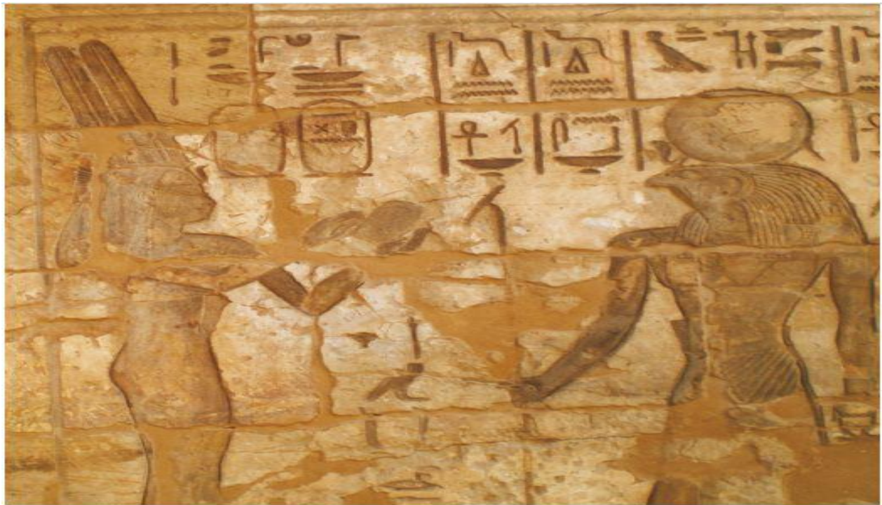
(شینوهی ۲) هوسه‌ری خودایی شین ئوبتی دووهم له‌که‌رنه‌ک وه‌رگه‌راوه له: (2009, fig. 2.10. Ayad)