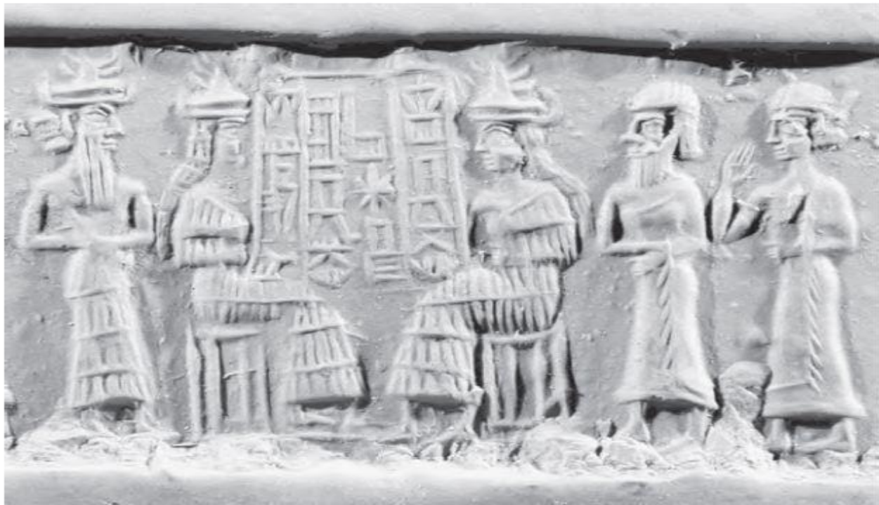
(شیوهی ۱) جی مۆری ژنه‌کاهینیکی بالا هاوسه‌ری خواوه‌ند به‌ناوی نینسای کچی پاشای ئەکه‌دی لوگال-تار وه‌رگه‌راوه‌ له: (Suter, 327-328, fig.5)