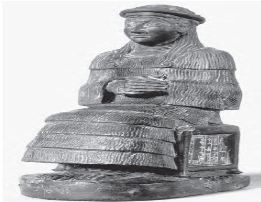
(شیوهی ۵) په‌یکه‌ری ژنه‌کاهین ئیناناتوم هاوسه‌ری خواوه‌ند وه‌رگه‌راوه له: (Suter, 2007, fig.9)