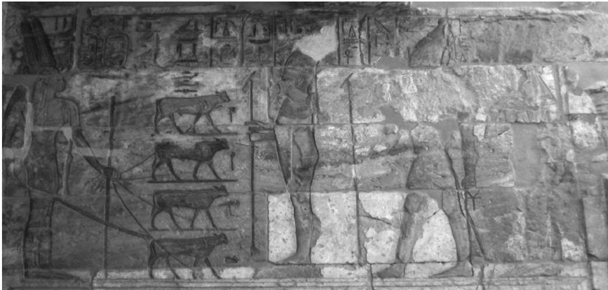
(شیوهی ۴) دیمه‌نی بردنی ۴ کۆلک له‌لایهن ژنه‌کاهین شبن ئوبتی دووهم-که‌رنه‌ک وه‌رگه‌راوه له: (Ayad, 2016, fig 5)