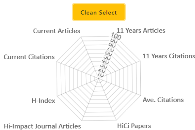
شیوه ی (۳) دیاریکردنی پیوه ر و نیشاندهره کان، وکیشه کانیان

۲- کارگه ری توپزینه وه: ژماره ی سایته یشنه ی بابه تیکی ئەکادیمی تاییه ت له چوارچینه ی کاتیکی دیاریکراودا نیشاندیریکی باو و په سه ندرکراوه بۆ کارگه ریه کانی ئەو بابه ته، ئەم سیستهمه ریزه ندییه هه ردوو کارگه ری دریتخایه ن وکورتخایه نی توپزینه وه تاییه تەکان له به رچا و ده گریت هه ولده دات نوینه رایه تیه کی دادپه روه رانه تر